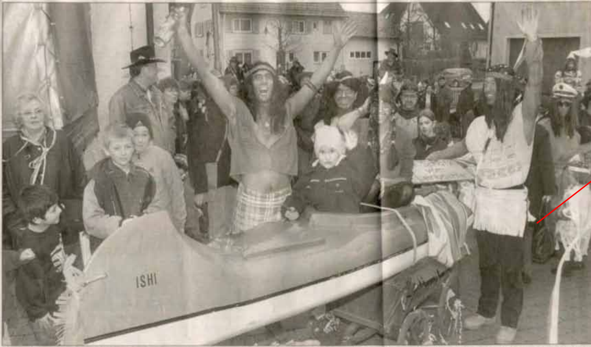
Wo sind all die Indianer hin? Natürlich beim großen Western-Kärreles-Umzug der „Leincreek“-Cowboys von Neckargartach. Der erste Rosenmontags-Zug seit 50 Jahren war für die Organisatoren ein voller Erfolg. Im nächsten Jahr sollen auch andere Vereine mitmachen.