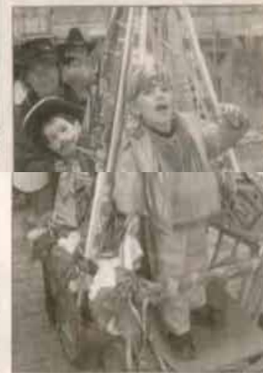
In ihrem Tipi fühlt sich die kleine Squaw pudelwohl.