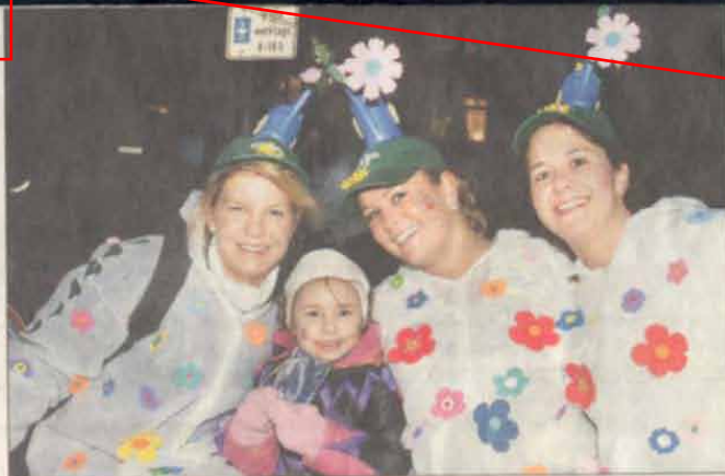
Die Neckargartacher Handballerinnen präsentierten sich als Flowerpower-Mannschaft bester Laune.

Während einige Anwohner auf dem Balkon stehen, gibt es auf der Straße „Neggergärdicher Guggamusch“. Die „Neggergärdicher Häxe“ wickeln so manchen Mann um den kleinen Finger. Den Abschluss bildet der OBI-Fußballwagen – mit kleinem Fußballtor und -feld. Die Baumarkt-Mitarbeiter tragen Trikots von Teams aus aller Herren Länder – ganz im Zeichen der WM.