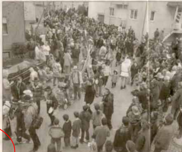
Die „Wegelagerer“ begrüßten den Cowboy-Treck stürmisch und konnten gar nicht genug bekommen vom Western-Feeling und den Süßigkeiten.