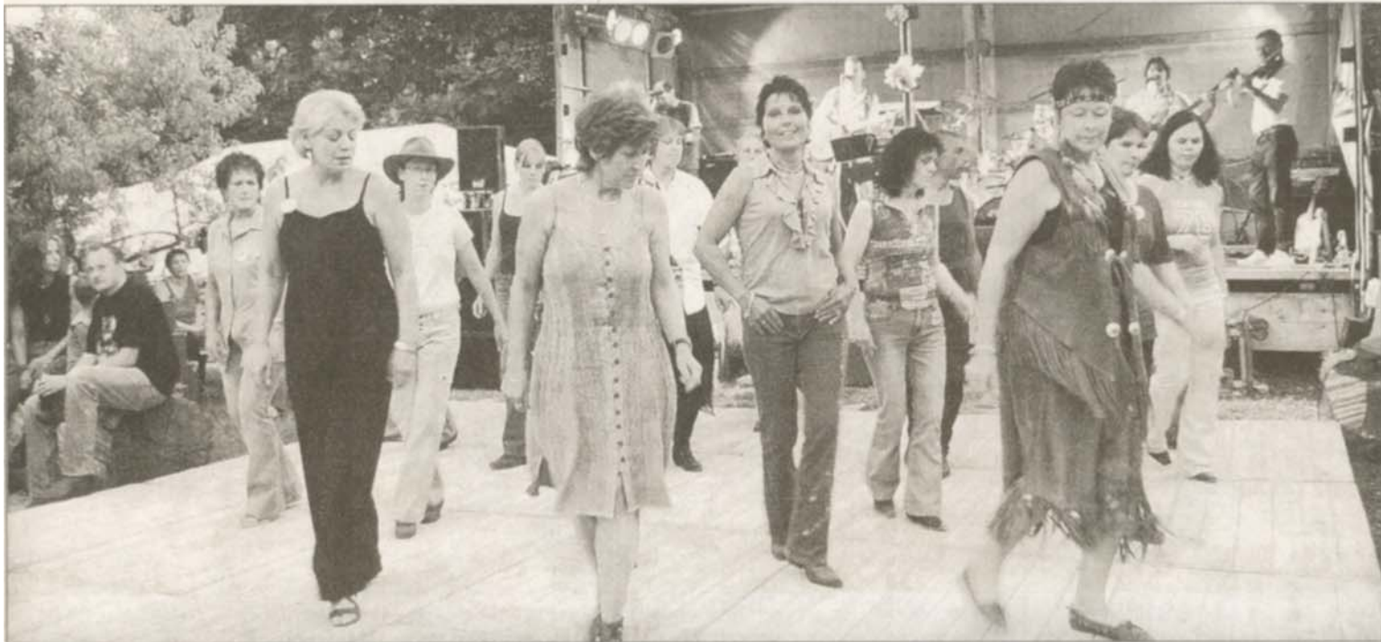
Mit einer Western-Party feierte der Leincreek Country Club in Neckargartach am Samstag seinen zehnten Geburtstag.

Neckargartacher Leincreek Country Club weihte mit Geburtstagsfest das neue Turniergelände ein